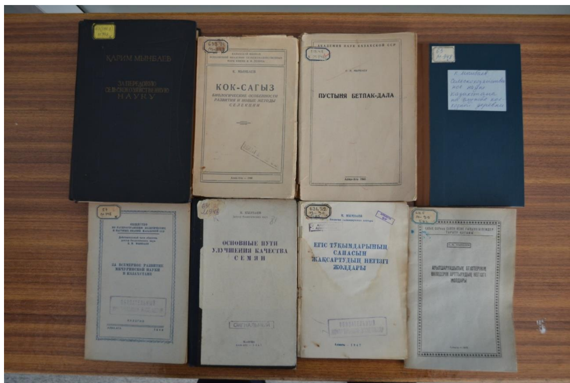
Кәрім Мыңбаевтың еңбектері Труды Карима Мынбаева

вопросам сельского хозяйства выходит 24-страничный материал, посвященный анализу трудов Карима Мынбаева.