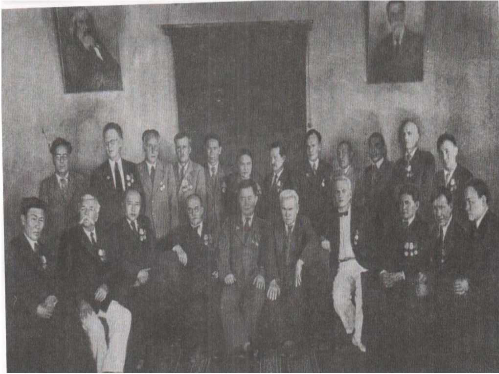
1946 жылы маусымда Қазақ КСР Ғылым академиясының I сессиясында сайланған академиктер мен корреспондент мүшелері

Академики и члены-корреспонденты, избранные на I сессии Академии наук КазССР в июне 1946 г.