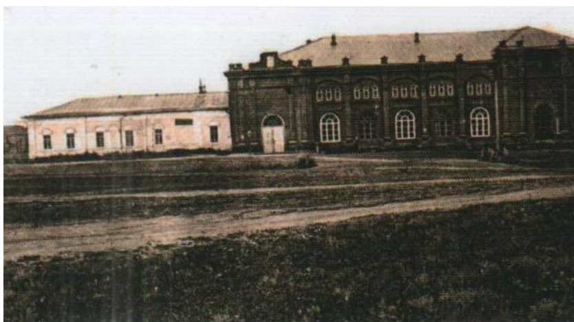
1948 жылы 1-5 наурызда Петропавл қаласында ВАСХНИЛ-дің Қазақ филиалының көшпелі сессиясы өткізілген ғимарат