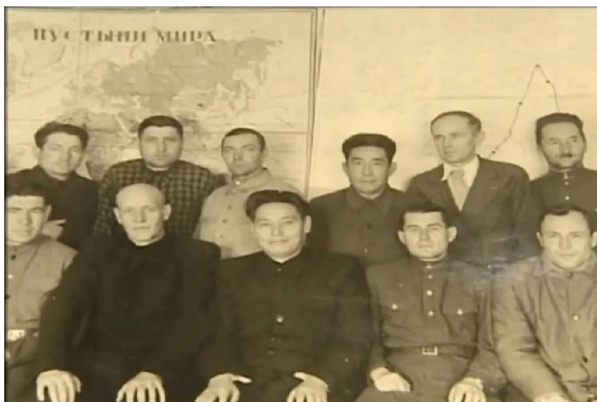
Кәрім Мыңбаев Бетпақдала экспедициясы командасымен бірге

Он мечтал превратить Казахстан в республику, в которой производят большие объемы зерна и разводят племенной скот. Также ученый понимал важность селекции овощных растений, которые в казахской степи прежде не выращивались.